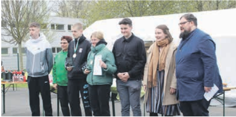
Nachdem die Teams die Strecke und die darin eingebundenen Aufgaben absolviert hatten, erfolgte die Siegerehrung.

Zurück in der Kreisverkehrswacht warteten weitere Herausforderungen auf die Teams. So waren unter anderem Geschicklichkeit und Mut im Überschlagssimulator gefragt. Weitere Punkte galt es beim Wissensquiz oder beim Fahrradparcours zu sammeln. Die jeweils erreichte Punktzahl entschied über die Vergabe der Siegerpokale. Über diese konnten sich bei der Siegerehrung am Nachmittag freuen: